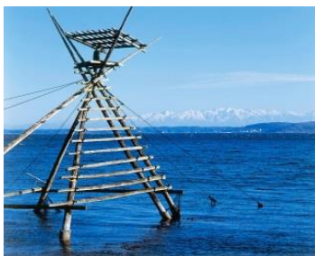
「能登の里山里海」は 世界農業遺産に認定