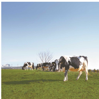
県内の生乳の約半分を内灘町で生産