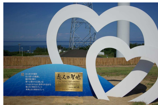
景色の美しさから恋人の聖地にも認定されています。